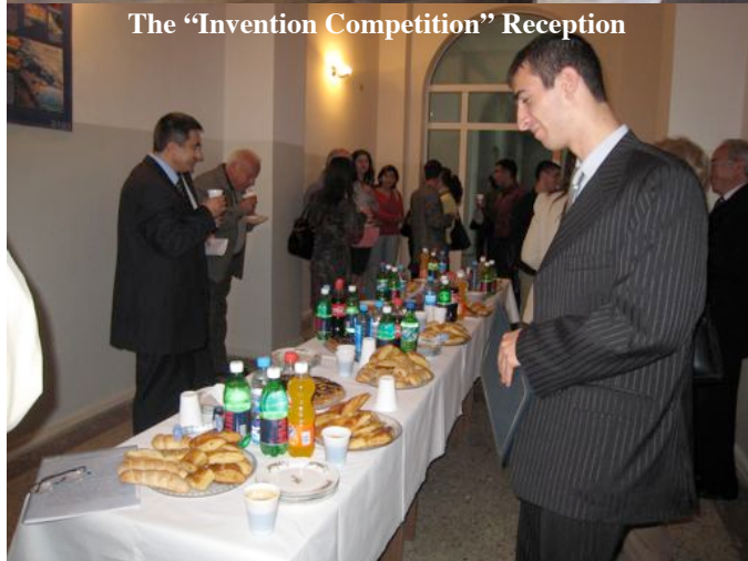
The “Invention Competition” Reception