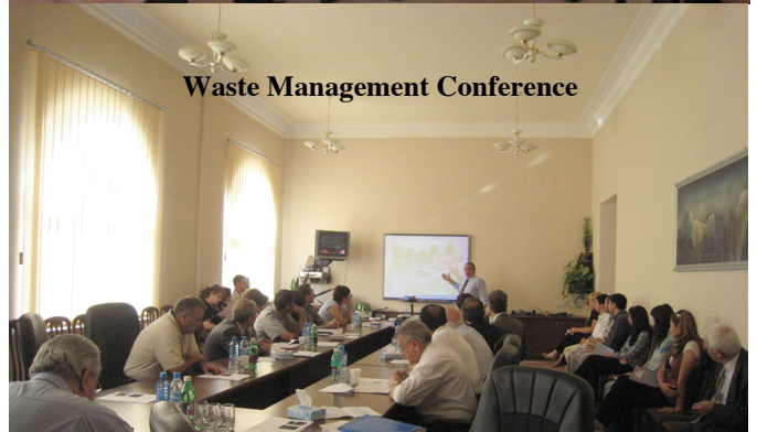
Waste Management Conference